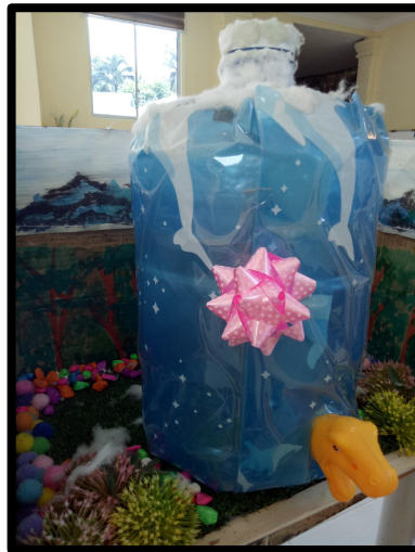
Botol dispenser yang siap dihias