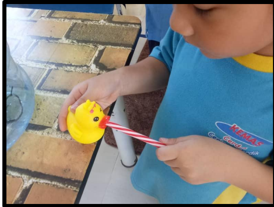
Adik Wafa memasukkan straw ke dalam mulut soft toy untuk membuat aliran air keluar