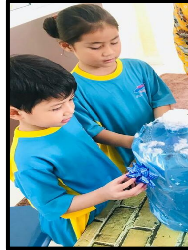
Kanak-kanak menghias botol dispenser mengikut kreativiti masing-masing